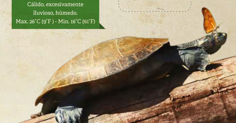
Aeropuerto: PEM (Padre Aldamiz)